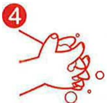
4 FINGERS INTERLACED