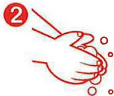
2 PALMA A PALMA