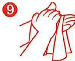
9 Manos secas