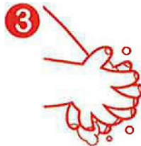
3 DORSO DE LAS MANOS