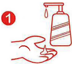
1 USE JABÓN

Mantener las manos limpias es una de las cosas más importantes que podemos hacer para detener la propagación de enfermedades respiratorias como la gripe y COVID-19.